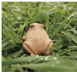
八二三紀念公園-小偉葉

地址： 台中市北屯區崇德十路與昌平路一段交叉口附近 交通資訊： 走國道1號下中清交流道一度中清路往市區方向直走→左轉潭中第一見崇德路右轉→再左轉接山西路→再接昌平路二側即可到達 大眾運輸： 台中市公車58、65號 占地面積： 26000平方公尺