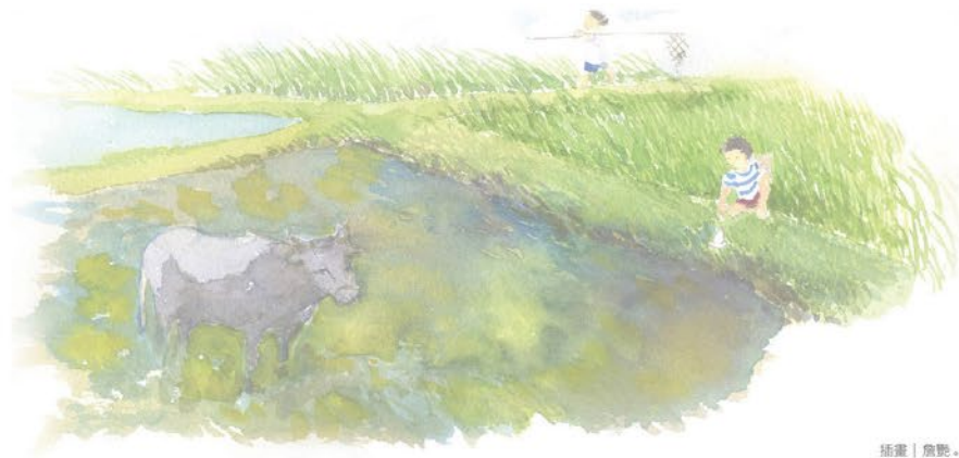
插畫 | 詹豐。

「趣味台語開講」單元，歡迎大家來投稿！投稿信箱：fully999@ms78.hinet.net P.S. 在投稿內容寫上聯絡電話、及聯絡人姓名喔！