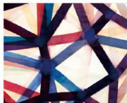
圖畫圖說：陳聖夫的繪畫作品，光的旋律。