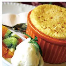
咖啡與舒芙蕾的交響曲 給自己一個多采、深情的風箏 在午後慵懶、微醺的陽光裡 是一份優遊沉靜的浪漫心情 是親生活與您一杯咖啡 和一份香酥輕軟的好美蔬