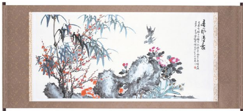
春風得意圖(七位大師合繪)

浙江餘姚人，字堪白，自幼隨父習字畫，書法上精通篆、隸、楷、行、草五體。曾任職國立故宮博物院書畫處處長，獲中國書畫學會金爵獎、中山文藝獎「篆刻類」。