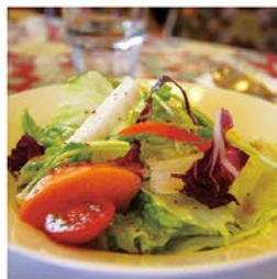
擇自然農法耕種的蔬菜 浪漫典雅的用餐環境 期許因蔬食而能帶動環保、節能 擴大自然生態恢復平衡 令地球轉向一個更美好的未來 要親生活我們一起島

格，自行選擇喜歡的菜色；馬鈴薯切片、酸黃瓜，有預算就再買個番紅花、增加厚實口感的雞蛋、預熱上百度烤箱，將美美蔬食切好鋪平在餅皮上、大量的起士，不要忘了將小番茄擺上，增加對比色澤，再來就屬於驚喜香氣，茴香是好選擇、或是羅勒...，就像是一個義大利媽媽的闖氣，烤個20～30分鐘，創造成果驚喜建議大膽嘗試，凝聚一家人情感回憶，最歡心的時刻，不要怕失敗，最主要是要for fun。如果偶爾～想要零誤差的美食、與鄉村氛圍，那我們就相約在法式餐廳，好好享受吧。