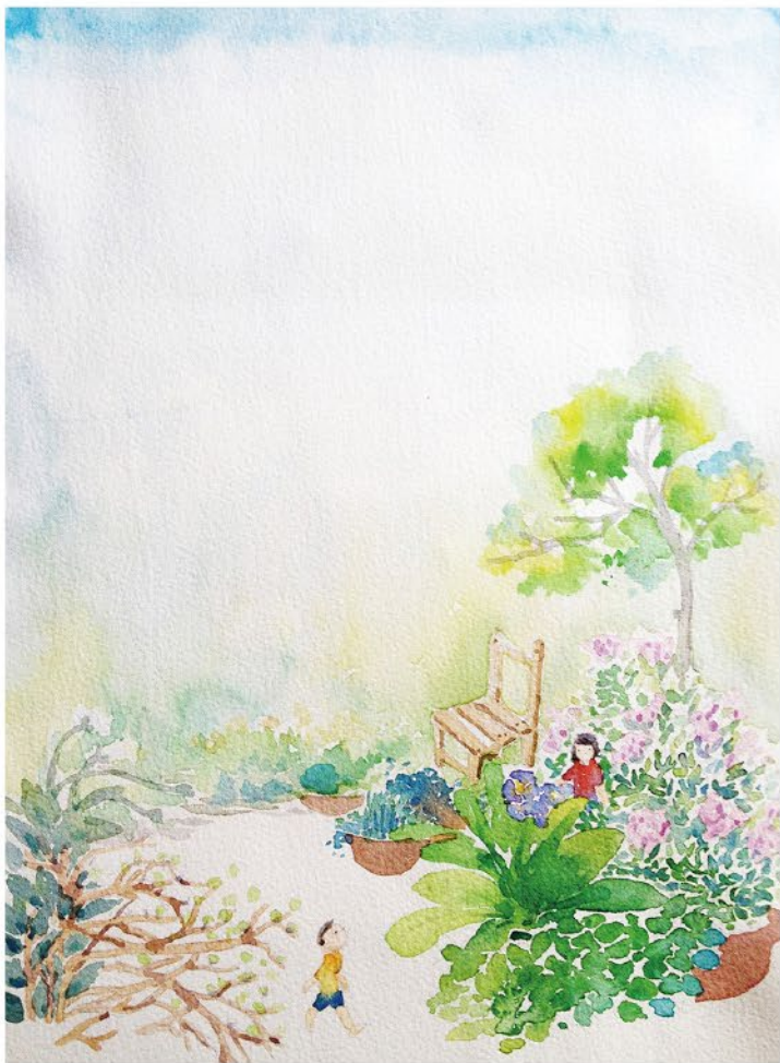
插畫 | 茲心