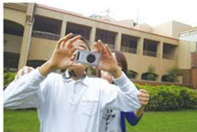
視障學生 / 吳景輝作品