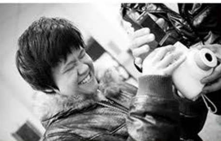
無畏團隊 / 教學側拍