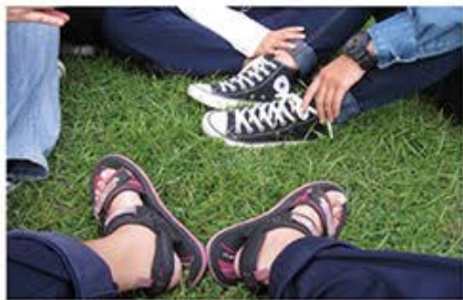
視障學生 / 小燕子作品